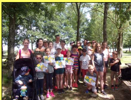
Course d'orientation à la Rincerie