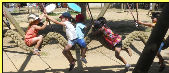
Sortie au Refuge de l' Arche