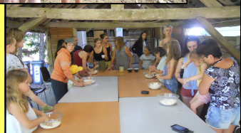
Journée à la ferme